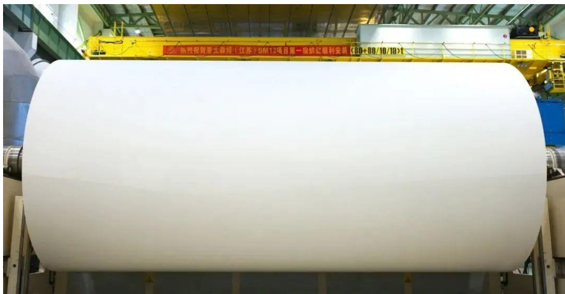
亚太森博（江苏）生产的白卡纸卷

10 月 20 日，在长约 690 米的造纸主厂房中，高速运转的纸机发出生机勃勃的轰鸣，首个崭新洁白的纸卷逐渐成型——金鹰集团旗下亚太森博（江苏）一期年产 100 万吨白卡纸项目成功投产。至此，金鹰集团白卡纸业务年产能迈向 160 万吨，进入全新高速发展阶段。