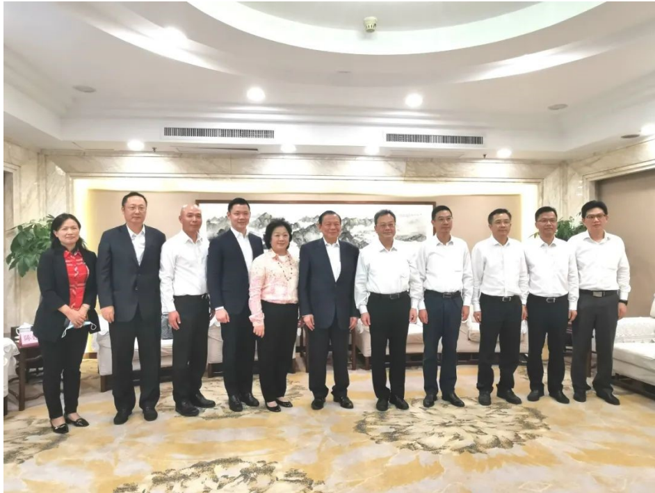
江门市市长刘毅、新加坡金鹰集团主席陈江和等与会领导、嘉宾合影