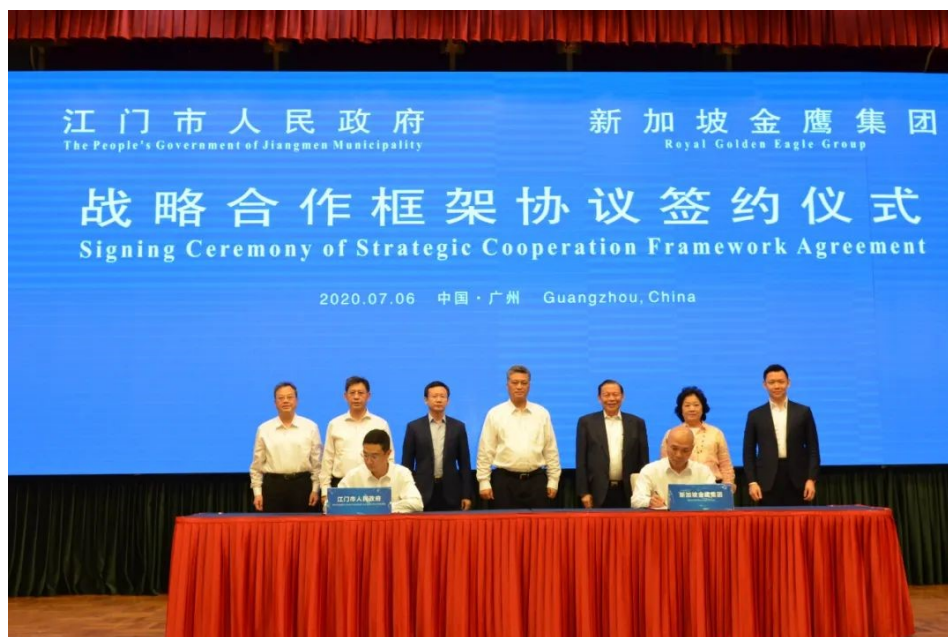
广东省省长马兴瑞、新加坡金鹰集团主席陈江和等领导、嘉宾见证签约仪式

7月6日下午，江门市人民政府与新加坡金鹰集团旗下亚太森博（广东）纸业有限公司签订高达200亿元的合作框架协议。广东省委副书记、省长马兴瑞、副省长张新、省政府秘书长叶牛平、新加坡金鹰集团主席陈江和及其夫人黄瑞娥、董事陈建升等出席活动并见证签约。