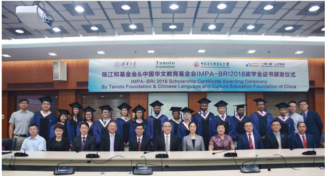
一带一路国际公管硕士项目首届毕业生合影